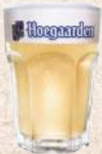
豪格登(2.5L) Hoegaarden (2.5L) (小麥5%)