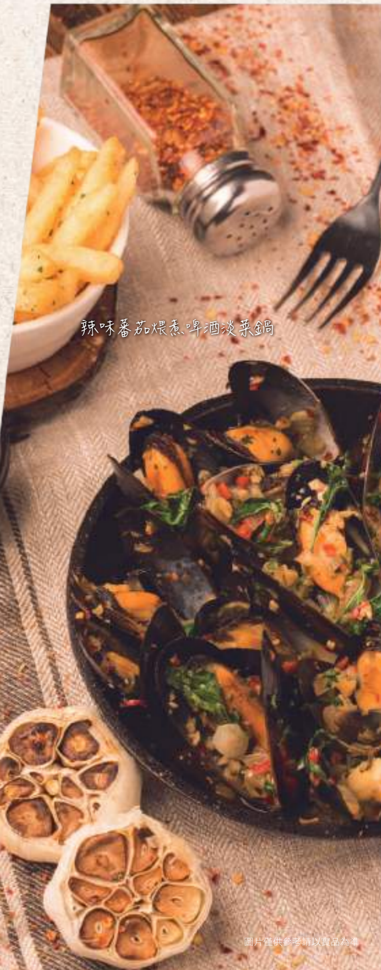
辣味蕃茄煨煮啤酒淡菜鍋