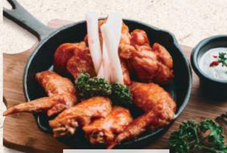
美國水牛城辣雞翅

以下拼盤系列任選三種 NT$750 份量不變 NT$750 for 3 of chooses