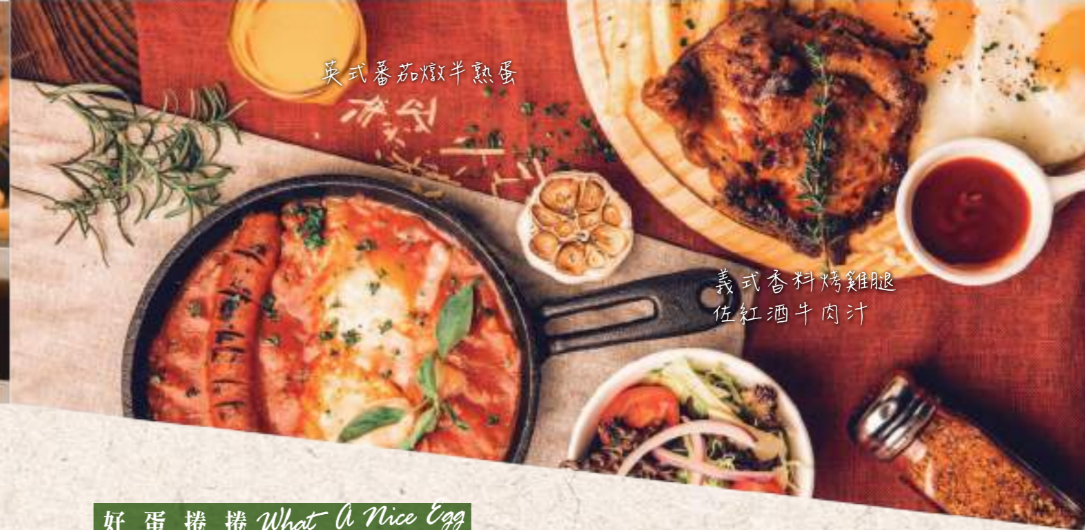
英式蕃茄燉半熟蛋