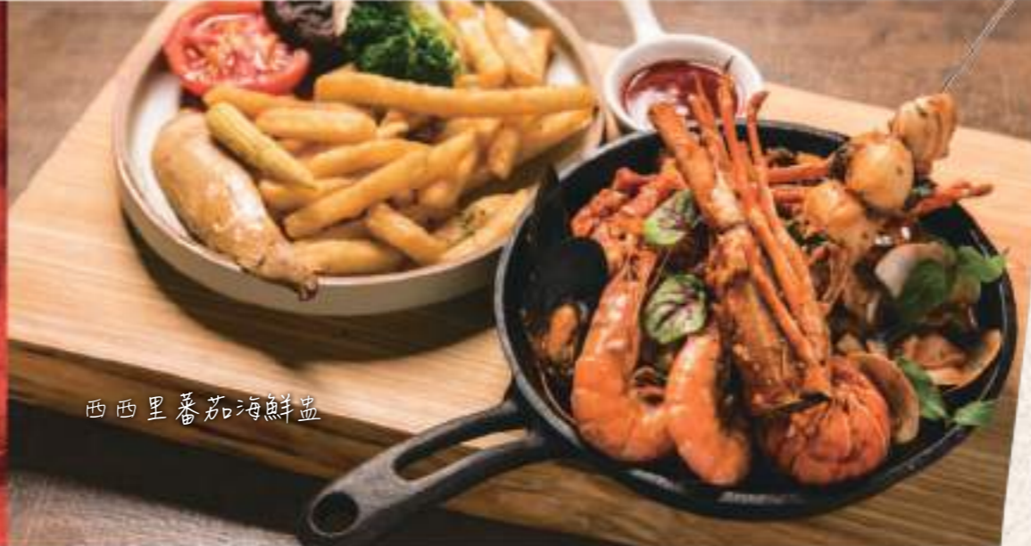
西西里蕃茄海鮮盅