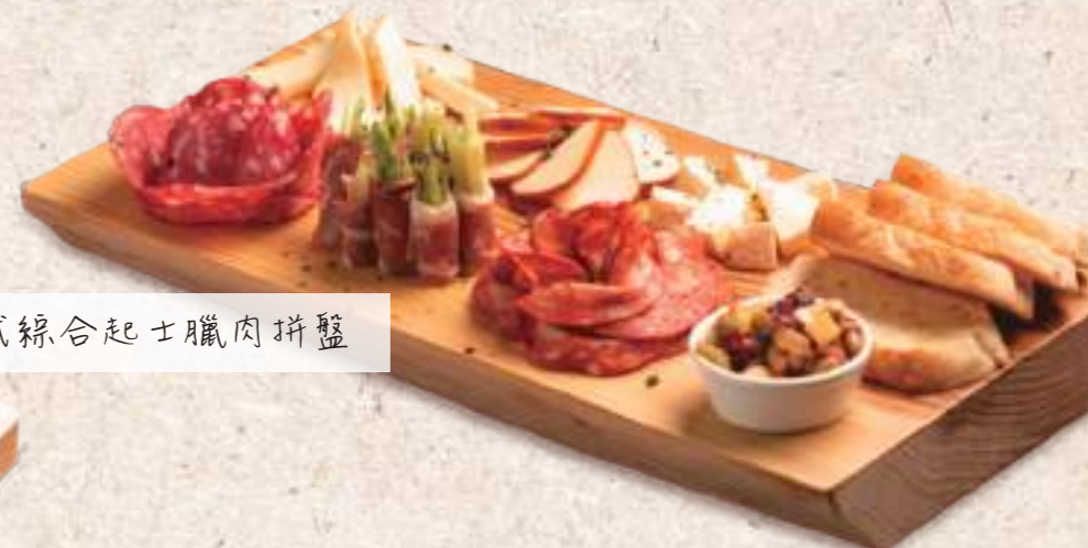
歐式綜合起士臘肉拼盤