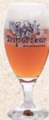
天堂金(3L) Triporteur Heaven (3L) (大麥6.2%)