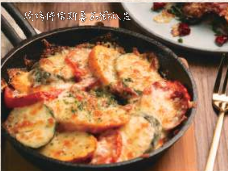
焗烤佛倫斯蕃茄柳瓜盅