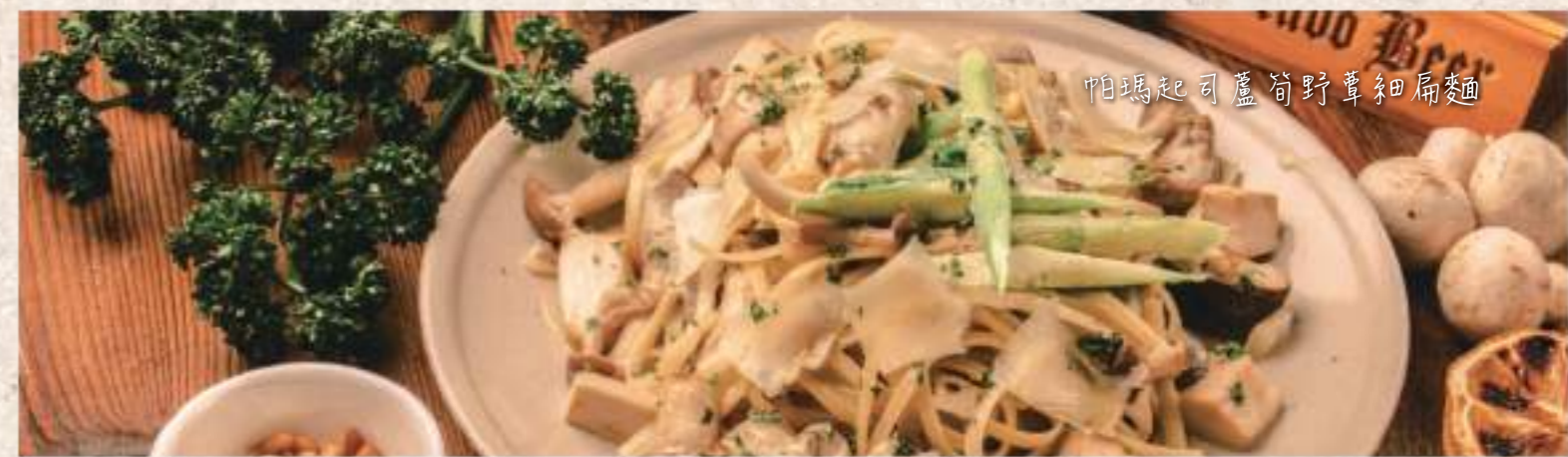
帕瑪起司蘆筍野蕈細扁麵