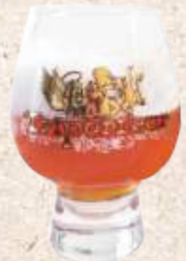
不可言喻(3L) Triporteur Nipple (3L) (大麥8.5%)