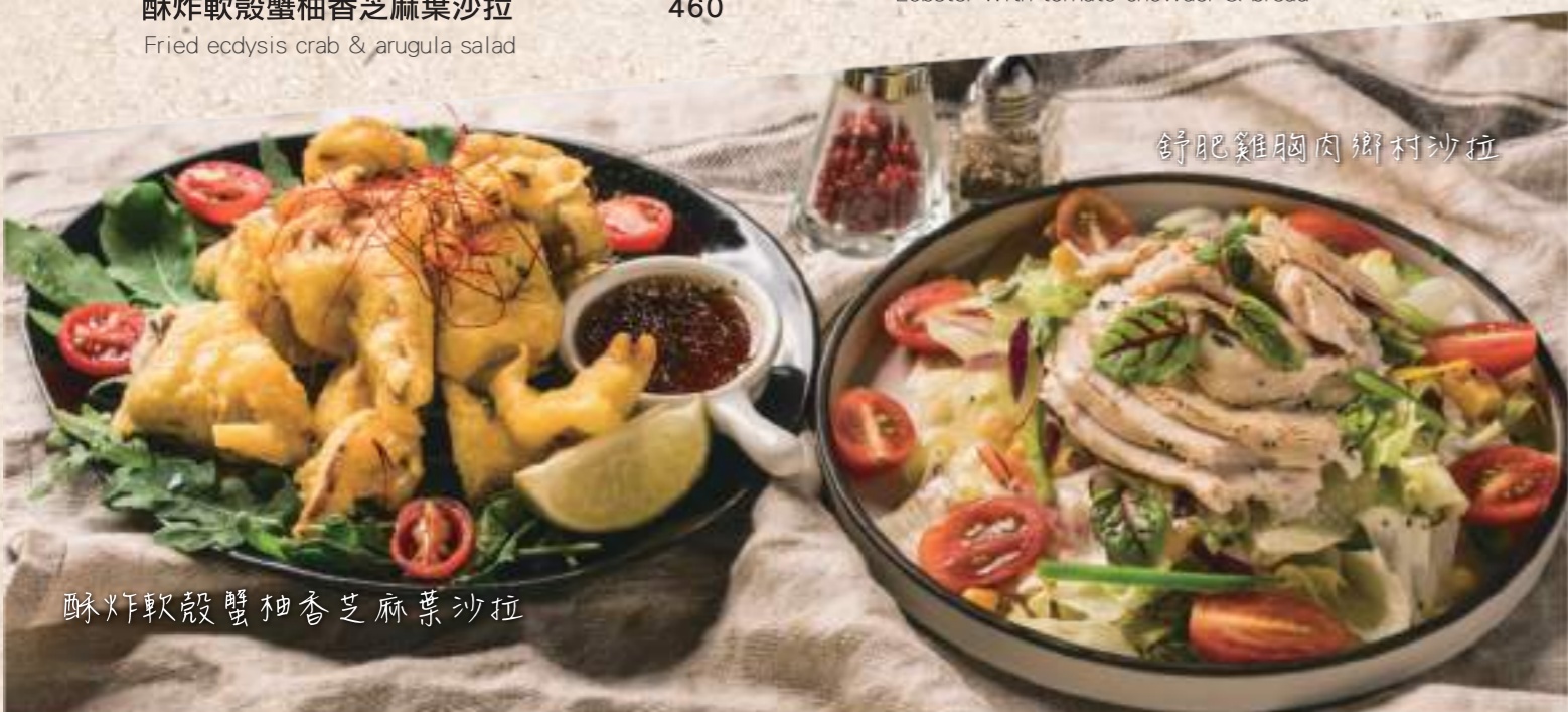
酥炸軟殼蟹柚香芝麻葉沙拉