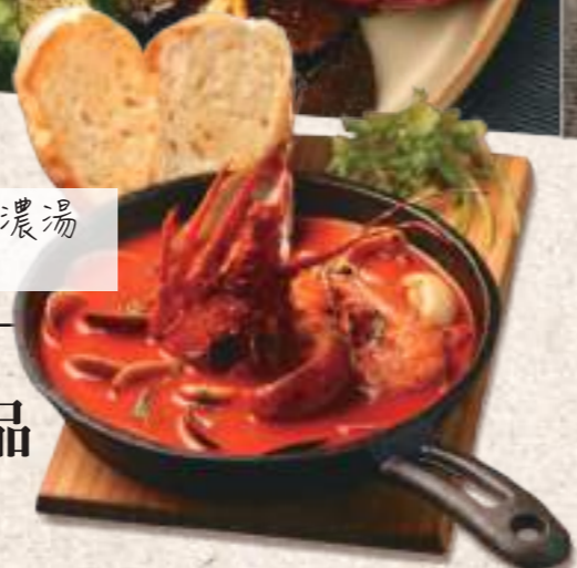
地中海式龍蝦海鮮濃湯 佐手工麵包