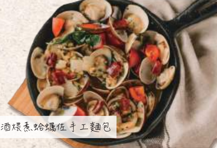
比利時啤酒煨煮蛤蠣佐手工麵包

本餐廳使用美國、澳大利亞進口牛肉 可蛋奶素食烹調,請先告知服務人員依個人需求作準備 vegetarian, please inform