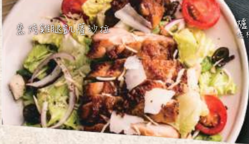
爐烤綜合野菇蔬菜 佐松露陳年葡萄酒醋