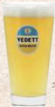
凡迪特白(3L) Vedett extra white (3L) (小麥4.7%)