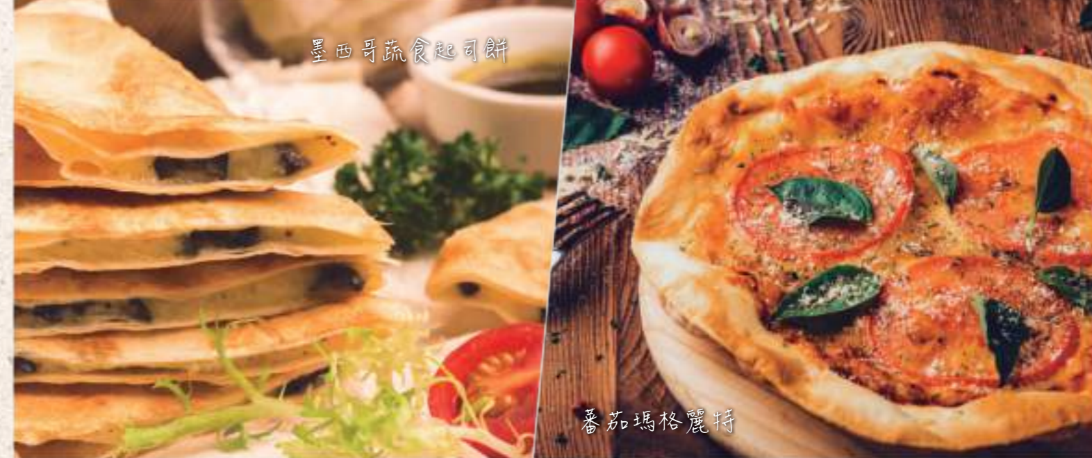
墨西哥蔬食起司餅